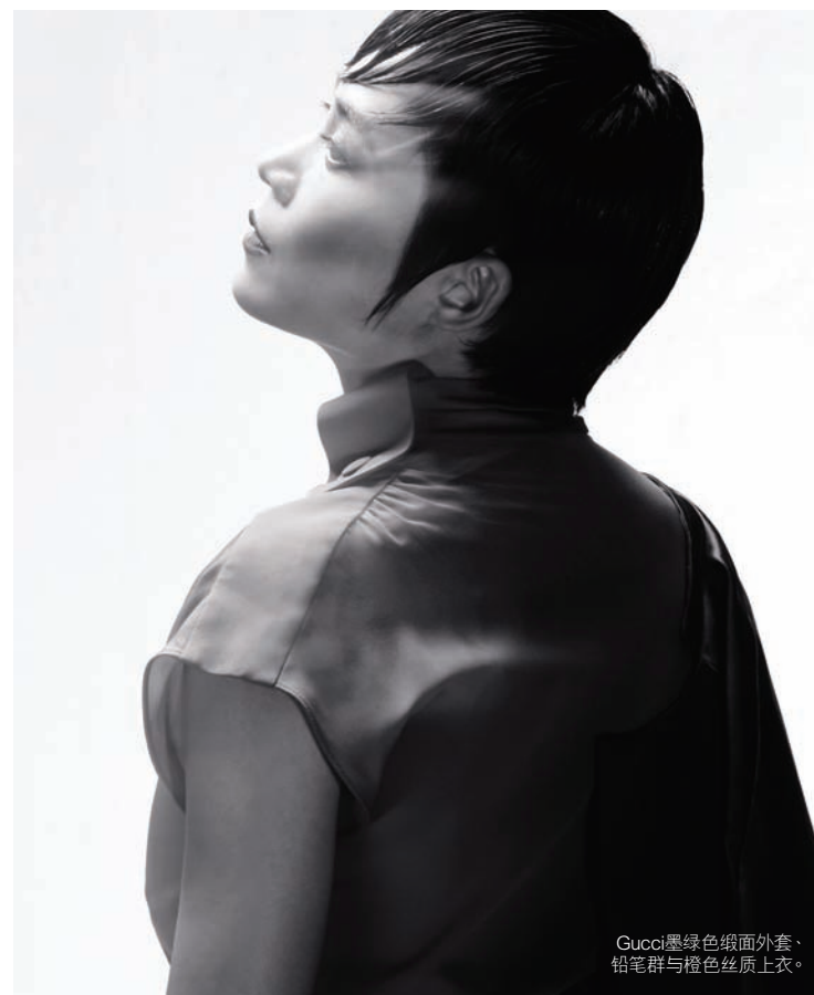
Gucci墨绿色缎面外套、铅笔群与橙色丝质上衣。

马来西亚电视观众真正见到她如火纯青的演技，是2009年的ntv7重头剧《女头家》，她也凭着这部电视剧获得了第一届ntv7金视奖最佳女演员殊荣。当时她只身北上来到吉隆坡参与演出，觉得这个没有朋友的吉隆坡，感觉比外国新加坡还要遥远。每天除了拍剧以外，陪伴着她也只有剧本而已。“当初