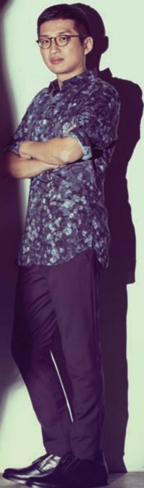
Paul Smith 印花衬衫 与长裤；ck Calvin Klein 黑色皮鞋。

唯目前Khoon Hooi放眼国际，积极地进驻如巴黎等国际时尚之都的时尚周大舞台，让更多人认识这个来自马来西亚的时尚品牌。