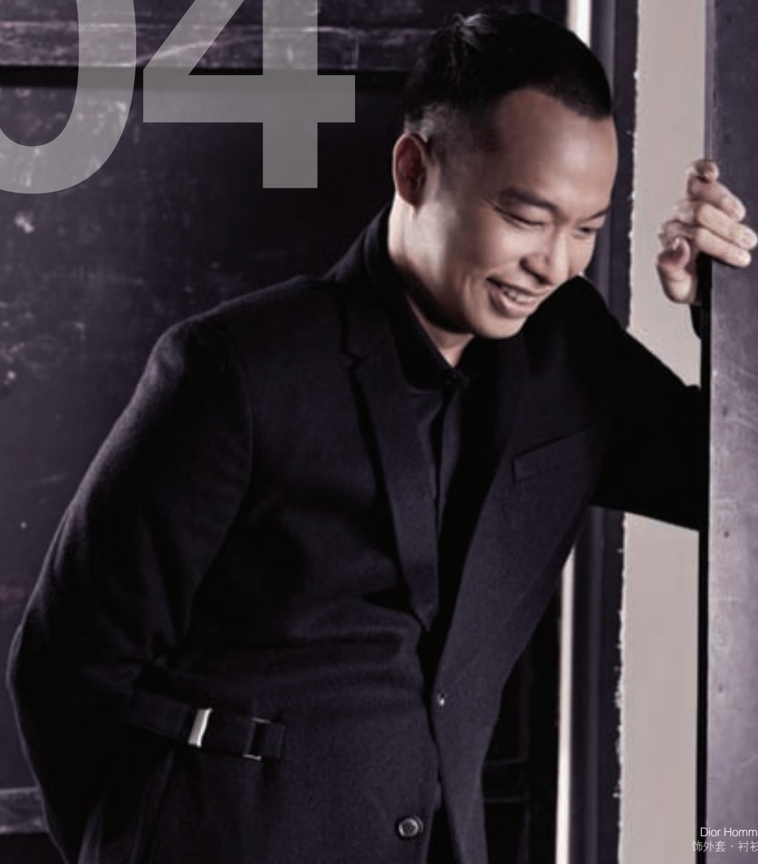
Dior Homme 黑色扣饰外套、衬衫与长裤。